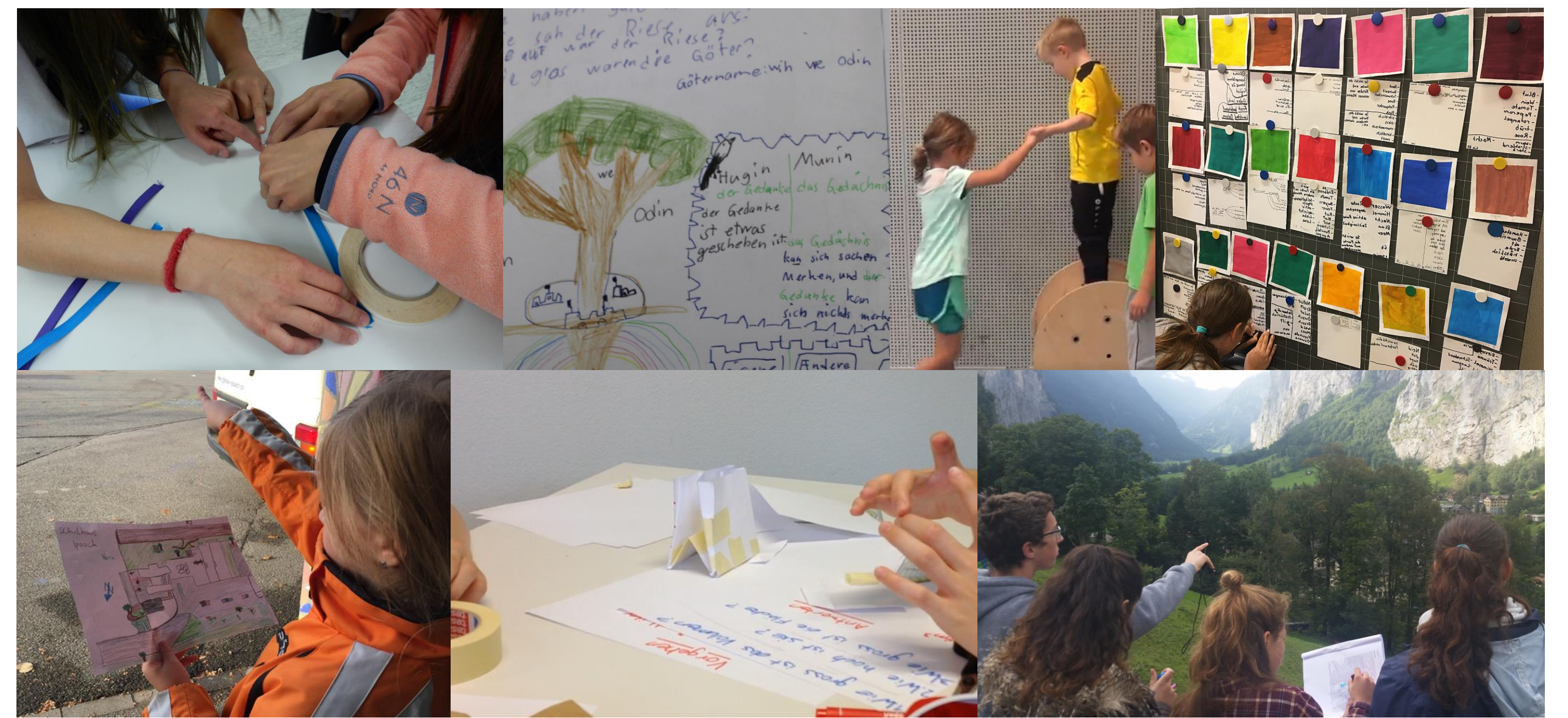
Fotoaufnahmen aus den Unterrichtserhebungen der beteiligten Fachbereiche

Die Fallbeispiele folgen fachspezifisch ausgewählten Fragestellungen und werden mit Beiträgen zum Unterrichtskontext, zum Fachverständnis, zu Aspekten des kompetenzorientierten Fachunterrichts sowie mit Analysehilfen begleitet.