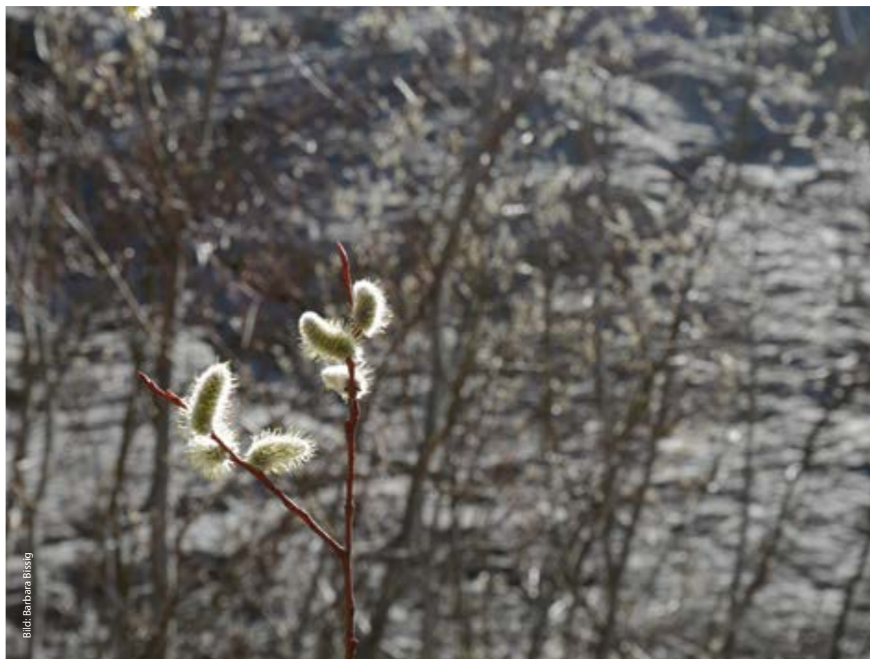
«Die Augen schliessen und der Musik lauschen. Die Nase empfängt die Frühlingsdüfte. Und die Sorgen sind weit weg.» (Klaus Siebold)