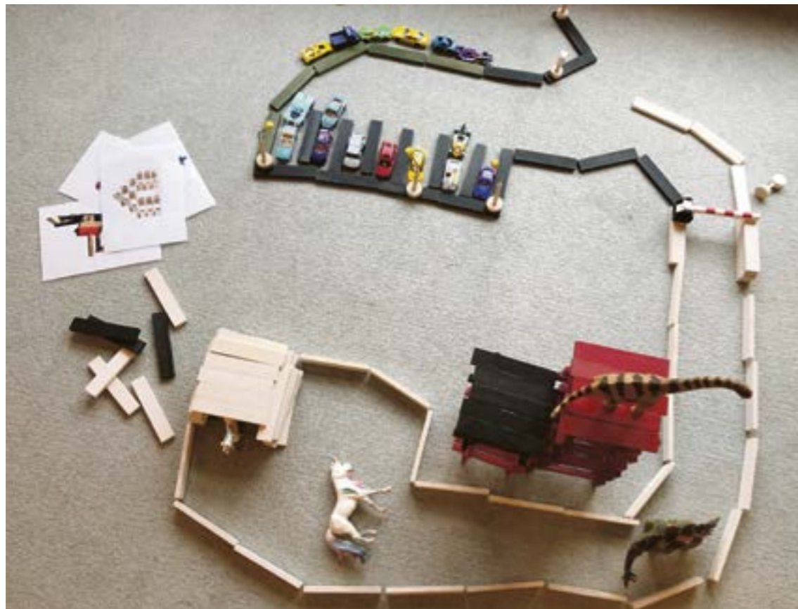
«Kleine-Welt-Spiel» mit Kaplas im Kindergarten.

Fragen zu Themen wie Diversity und Gender sind im schulischen Kontext allgegenwärtig. Ein Praxisbeispiel zeigt auf, wie der Diversität und Gleichstellung der SchülerInnen im Schulalltag Rechnung getragen werden kann.