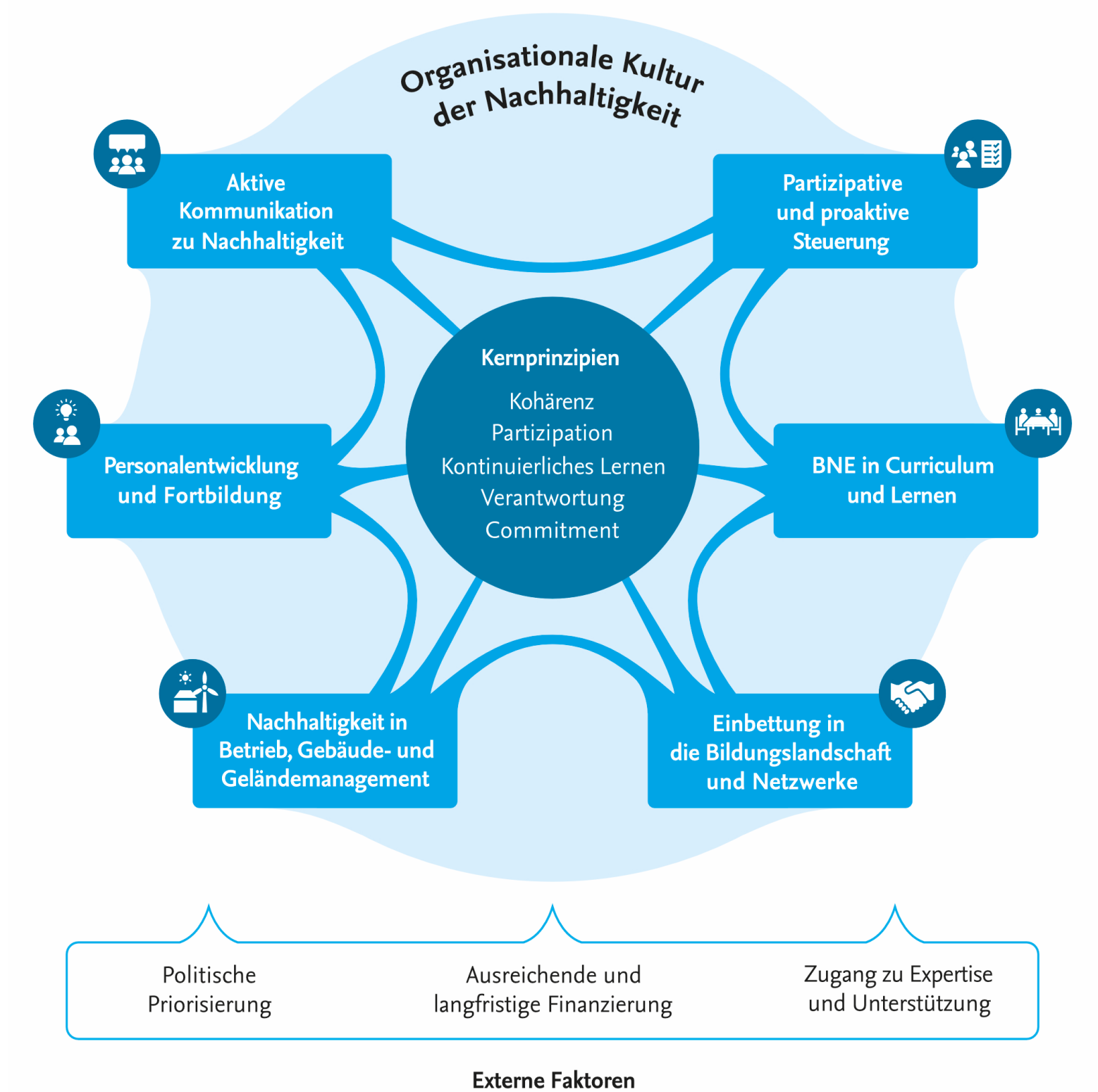
Whole Institution Approach Nachhaltigkeit an Bildungseinrichtungen

Die nicht-repräsentativen Ergebnisse der Station 1 (Meinungstör) zeichnen ein grundsätzlich positives Bild der Nachhaltigkeitskultur an der PHBern. Sie zeigten aber zugleich ein Entwicklungsbedarf in allen Dimensionen. Station 2 zielte darauf, diese Befunde aus verschiedenen Perspektiven zu vertiefen und eine Ausrichtung für ein Realexperiment zu definieren, das die Nachhaltigkeitskultur im Sinne der Beteiligten stärken soll. Dazu wurden zunächst über zwei Wochen hinweg differenzierte Statements skaliert bewertet und nach Stakeholdergruppen farbcodiert. Anschliessend wurden auf der Grundlage der Ergebnisse fünf thematische Optionen für das Realexperiment zur Abstimmung gestellt.