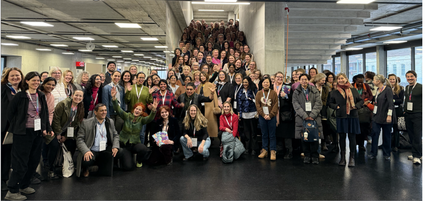
Fokus Migration, PH Bern, 10.01.2026